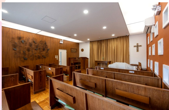
大学满足不同宗教社群的需要，推动共融环境。图为富尔敦楼的「空间@JFC」（左图）和小礼拜堂（右图）。

大学设有多个共融设施，以实践种族共融理念。学生和教职员可使用适合各种信仰和习俗的祈祷和冥想空间。例如伊斯兰文化研究中心致力促进伊斯兰文化的学术研究及凝聚校内的穆斯林社群，并在校园内安排周五主麻礼拜、迎新及开斋聚餐等。